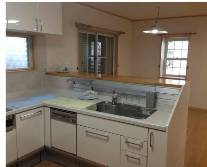
カウンターキッチン/LDK16帖